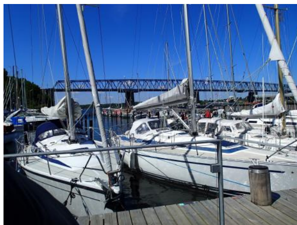
Billedet er taget fra det sted hvor vi grillede pølser.

Husk at formanden vælges særskilt på generalforsamlingen.